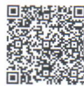
แบบฟอร์มรายงานตัวสำหรับนักศึกษาและบุคลากร

๓. การเดินทางกลับเข้ามาในพื้นที่ ให้บุคลากรและนักศึกษาเดินทางกลับเข้ามาในพื้นที่ มหาวิทยาลัยราชภัฏสกลนคร ตามกำหนดการดังต่อไปนี้