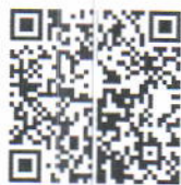
ระบบรายงานตัวเข้าจังหวัดสกลนคร

๒. ข้อปฏิบัติสำหรับบุคลากรและนักศึกษา ที่เดินทางกลับเข้ามาในพื้นที่จังหวัดสกลนคร ต้องปฏิบัติตามมาตรการของจังหวัดสกลนคร โดยลงทะเบียนรายงานตัวผ่านทางแอปพลิเคชัน “ระบบรายงานตัวเข้าจังหวัดสกลนคร ” หรือ สแกนคิวอาร์โค้ดผ่านมือถือสื่อสารโทรคมนาคม หรือรายงานข้อมูลต่อ “ศูนย์บริหารจัดการความเสี่ยง” มหาวิทยาลัยราชภัฏสกลนคร งานอนามัยและสุขาภิบาล โดยสแกนคิวอาร์โค้ด “แบบฟอร์มรายงานตัวสำหรับนักศึกษาและบุคลากร”