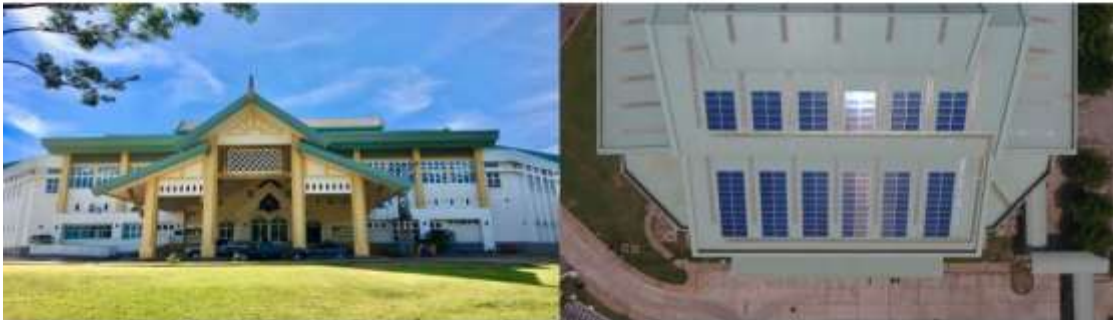
อาคารสำนักงานอาคารสถานที่และยานพาหนะ