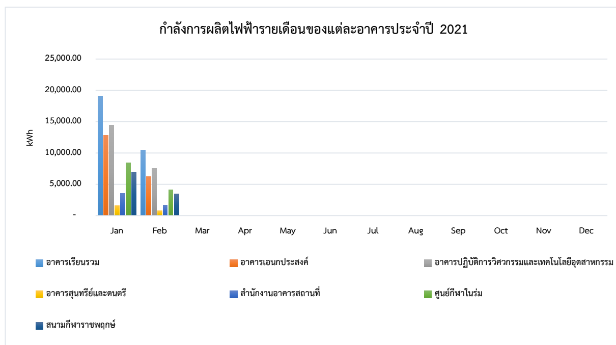
รูปที่ 5 ผลการผลิตไฟฟ้ารายเดือนของแต่ละอาคารประจำปี 2564

ในการดำเนินโครงการด้านพลังงานทดแทน ทั้ง 2 ระยะ มหาวิทยาลัยราชภัฏสุพรรณบุรีได้ดำเนินการติดตั้งระบบผลิตไฟฟ้าด้วยเซลล์แสงอาทิตย์บนหลังคา โดยมีกำลังการผลิตไฟฟ้าทั้งหมด 505 กิโลวัตต์ และระบบกักเก็บพลังงาน 300 กิโลวัตต์-ชั่วโมง ใช้พื้นที่ติดตั้งทั้งหมด 7 อาคาร เริ่มเปิดใช้งานระบบระยะที่ 1 ในวันที่ 18 พฤษภาคม 2562 และระยะที่ 2 เริ่มเปิดทดลองใช้งานในวันที่ 17 มีนาคม 2563 ซึ่งสามารถแสดงผลการผลิตไฟฟ้าจากระบบผลิตไฟฟ้าด้วยเซลล์แสงอาทิตย์ได้ดังนี้