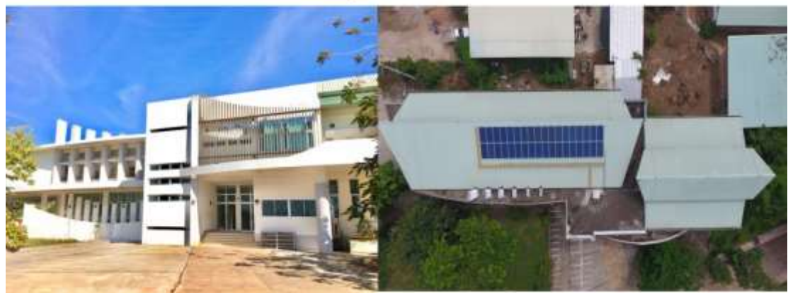
รูปที่ 2 ภาพรูปการณ์ติดตั้งระบบผลิตไฟฟ้าด้วยเซลล์แสงอาทิตย์บนหลังคา (ต่อ)