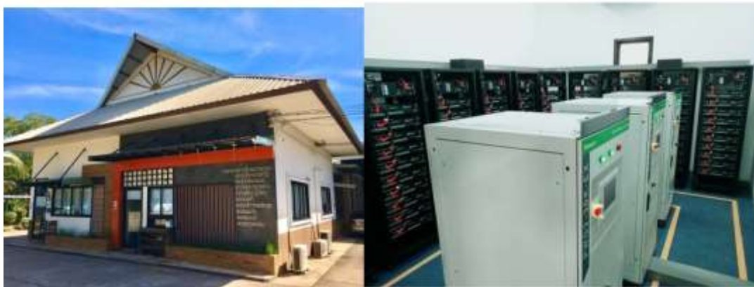
รูปที่ 4 ระบบกักเก็บพลังงานที่ติดตั้ง ณ อาคารสำนักงานอาคารสถานที่และยานพาหนะ