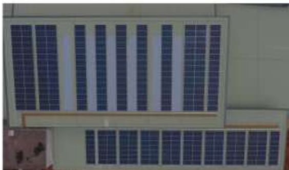
รูปที่ 1 ภาพรูปการณ์ติดตั้งระบบผลิตไฟฟ้าด้วยเซลล์แสงอาทิตย์บนหลังคา