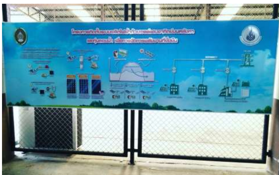
รูปที่ 3 ป้ายนิทรรศการด้านเทคโนโลยีพลังงานแสงอาทิตย์

ระบบกักเก็บพลังงานมีความจำเป็นสำหรับระบบไฟฟ้าในอนาคตเป็นอย่างยิ่ง เนื่องจากระบบกักเก็บพลังงานสามารถส่งเสริมให้ระบบผลิตไฟฟ้ามีเสถียรภาพและรักษาคุณภาพไฟฟ้าได้ นอกจากนี้ ยังเป็นส่วนสนับสนุนการเปลี่ยนโหลดทางไฟฟ้าไปสู่ช่วงเวลาที่เหมาะสม ซึ่งทำให้มีการบริหารจัดการพลังงานได้ดียิ่งขึ้น และนั่นหมายถึงความสามารถในการใช้พลังงานได้คุ้มค่า และเป็นการประหยัดพลังงานได้ด้วย บทบาทและวัตถุประสงค์ของระบบกักเก็บพลังงานไฟฟ้าแต่ละประเภทนั้นมีความแตกต่างกันออกไป แต่สำหรับในบทความนี้เราจะพูดถึงบทบาทการช่วยประหยัดพลังงานไฟฟ้า จากใช้งานระบบกักเก็บพลังงานไฟฟ้าในอาคาร เพื่อเป็นการอนุรักษ์พลังงานไฟฟ้าที่ใช้ในตัวอาคาร ในปัจจุบันอาคารขนาดใหญ่ที่ก่อสร้างขึ้นใหม่ มักจะมีระบบบริหารจัดการพลังงานในอาคาร (Building Energy Management System: BEMS) เพื่อช่วยในการจัดการควบคุม และติดตามระบบพลังงานต่าง ๆ ภายในอาคาร