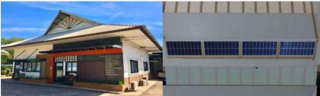
อาคารศูนย์และดนตรี