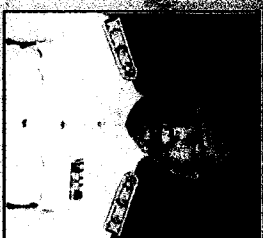
หัวหน้าพรรค