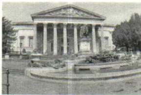
University of Bristol

ส่วนที่ 2 การส่งเสริมความร่วมมือด้านมหาวิทยาลัยเพื่อสังคม ภายใต้หัวข้อ “Public Engagement/Social Impact/Social entrepreneur/University-Industry Collaboration” จำนวน 5 แห่ง ณ เมืองบริสตอล และลอนดอน