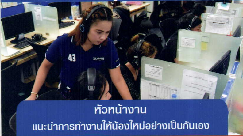
หัวหน้างาน แนะนำการทำงานให้น้องใหม่อย่างเป็นกันเอง