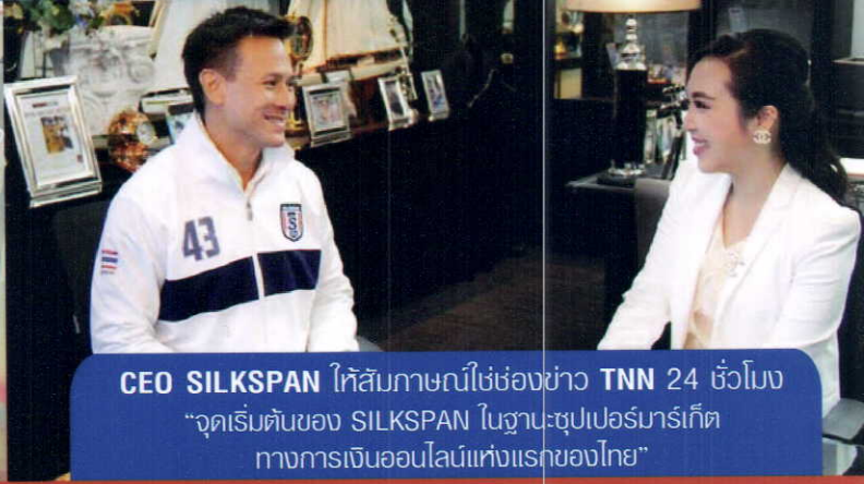
CEO SILKSPAN ให้สัมภาษณ์ใช้ช่องข่าว TNN 24 ชั่วโมง “จุดเริ่มต้นของ SILKSPAN ในฐานะซูเปอร์มาร์เก็ต ทางการเงินออนไลน์แห่งแรกของไทย”