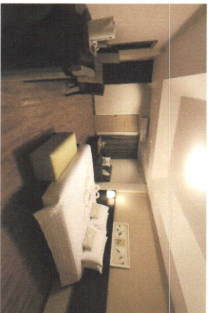
King Superior room (34 sqm.)