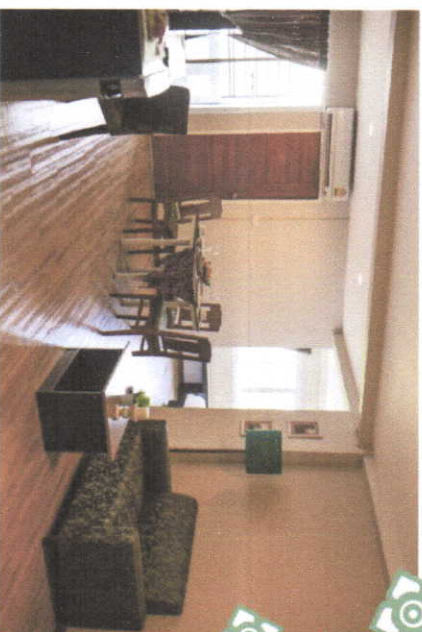
Executive Suites (50 sqm.)