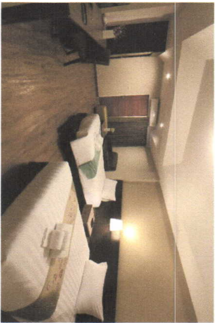
Twin Superior room (34 sqm.)