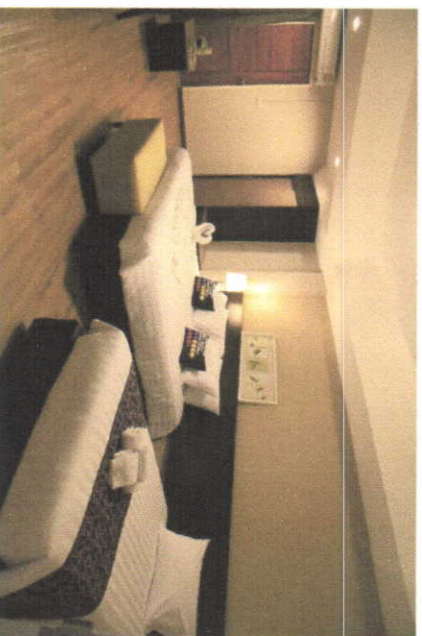
Triple room (42 sqm.)