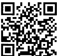
QR Code สำหรับ Global UGRAD 2017 Application